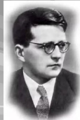
Дмитрий Дмитриевич Шостакович