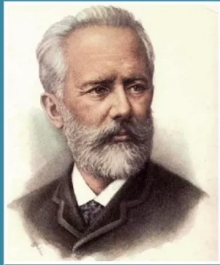
Пётр Ильич Чайковский