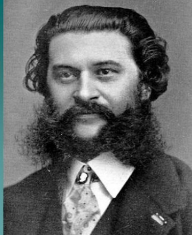
ИОГАНН ШТРАУС (Австрия)