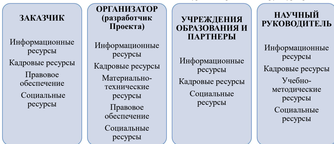
Схема 1. Ресурсная карта всех структур Проекта

Типы ресурсов , которые использованы в ходе реализации Проекта, представлены пятью обобщенными группами: